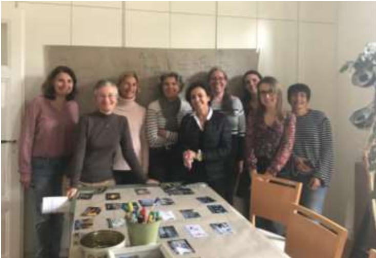
La fresque du climat